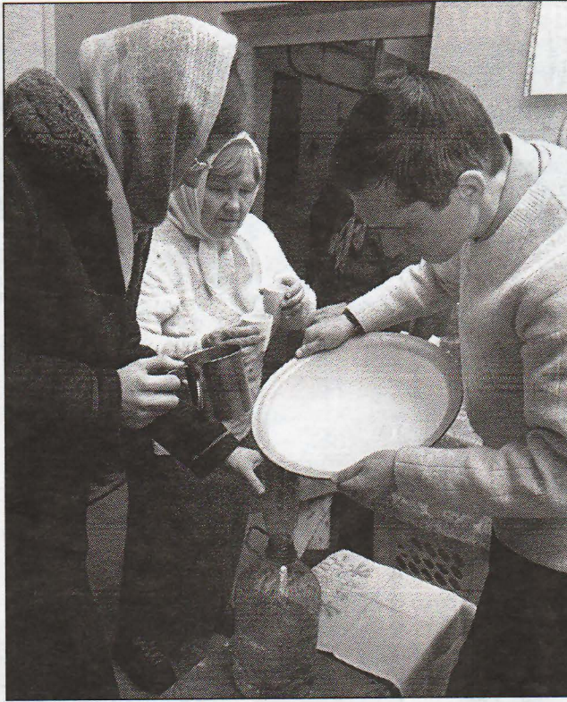
Святая вода пригодится на весь год.