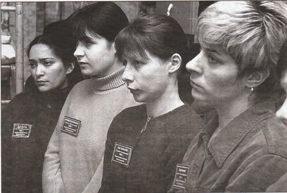
Заключенные переминались с ноги на ногу до тех пор, пока их не окропили святой водой и не отпустили восвояси.

Протоиерей Олег рассказывает о том, что тюремное служение — это не то же, что обычное. Говорит, что в местах изоляции заключенные не могут просто так собраться в храм, чтобы помолит-