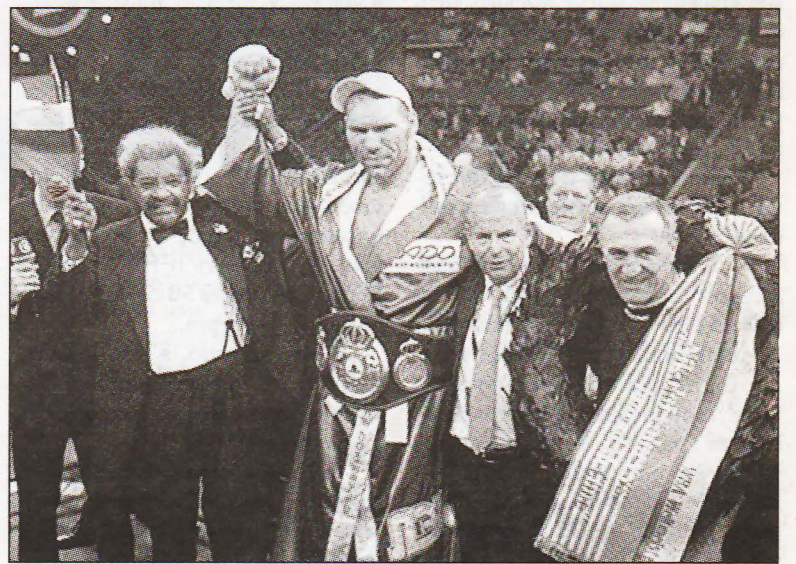
Контракт Валуева с Доном Кингом (слева) истечет после боя с Чигаевым.

лейн. — Я побил бы Валуева, а теперь мне придется завершить карьеру».