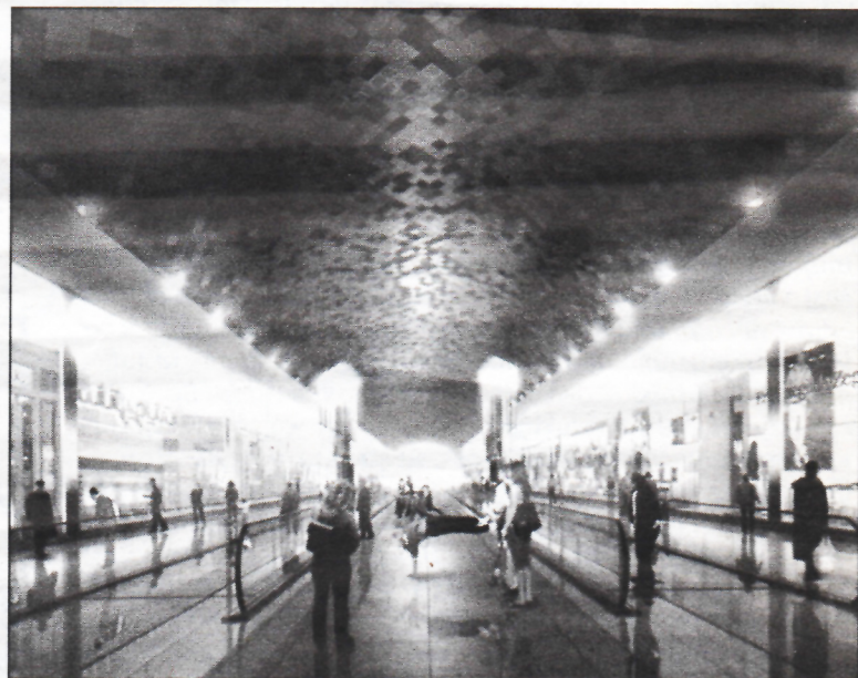
Сэр Норманн Фостер предлагает восстановить Яблочную площадь и устроить тоннели.

25 декабря правительственной комиссии придется выбрать один из двух проектов реконструкции Апраксина двора и окончательно определиться с тем, какой станет Апрашка к 2013 году. Оба проекта подготовлены английскими архитекторами, за каждым из них стоит крупный московский капитал: компании уже высказали готовность потратить намного больше, чем заявленные в инвестусловиях 10 млрд. рублей.