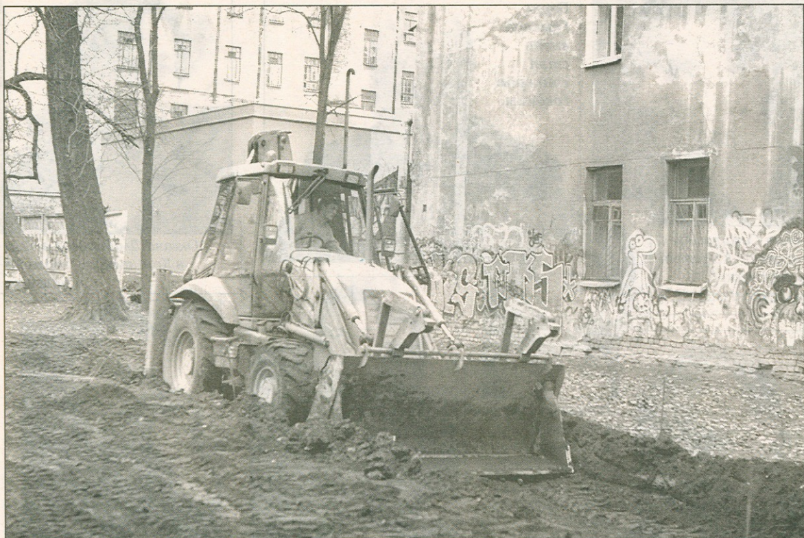
Строители начали работы с подготовки траншей для гранитных дорожек.