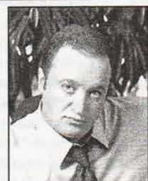
Бывший депутат ЗакСа, а ныне депутат Госдумы Денис ВОЛЧЕК (ЛДПР):

— Отмечать буду в кругу семьи. У нас будет чисто новогодний стол — жена знает, как его накрыть. Кстати, я живу в Пушкине, на Конюшенной, и у нас самое лучшее ТСЖ — оно так и называется «Конюшенный двор». Мы устраиваем там такой праздник, пускаем фейерверки, поем песни, танцуем... В общем, я всех приглашаю к себе на Новый год — пусть народ посмотрит, как можно у себя во дворе организовать праздник.