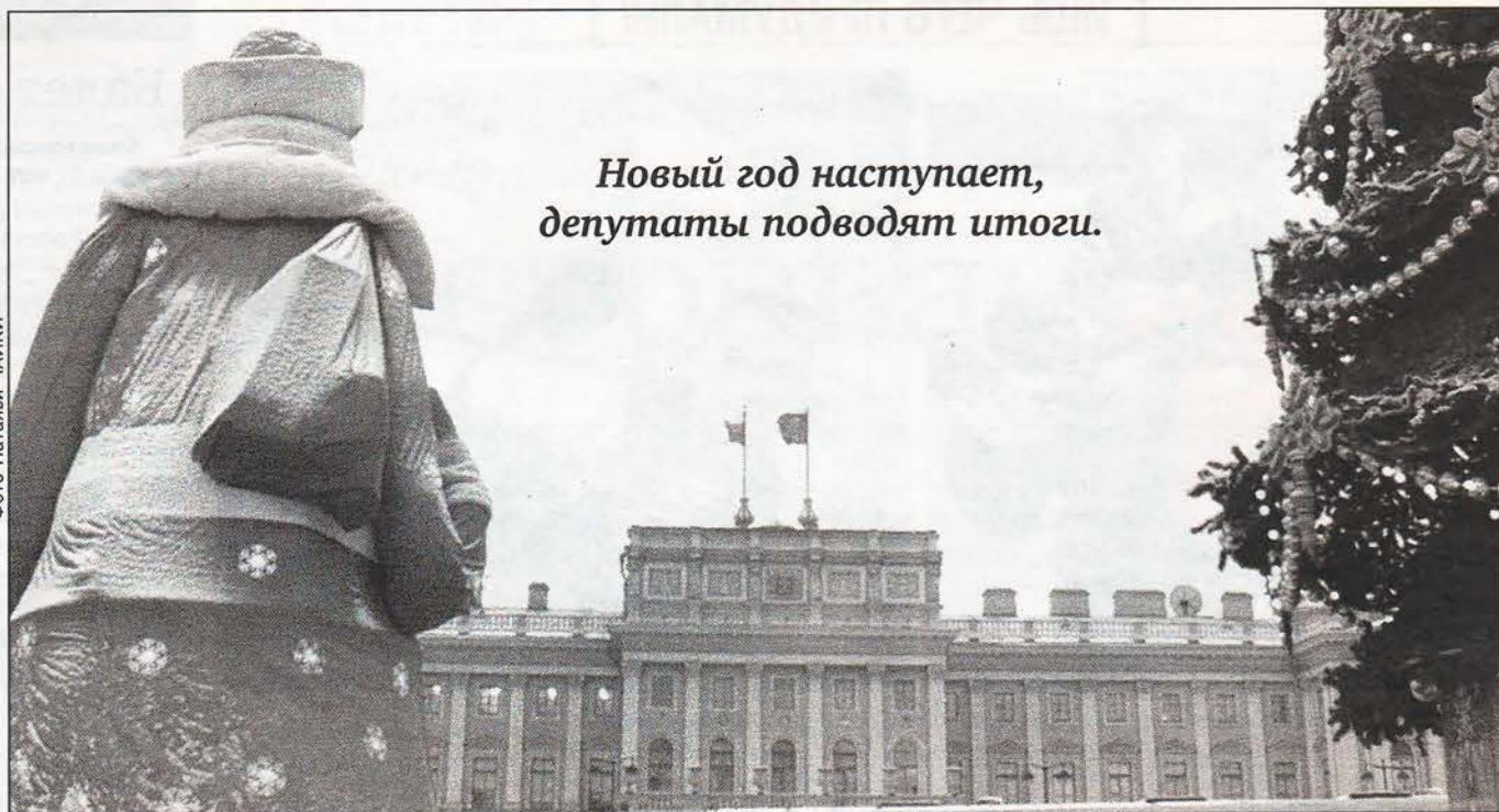
Новый год наступает, депутаты подводят итоги.