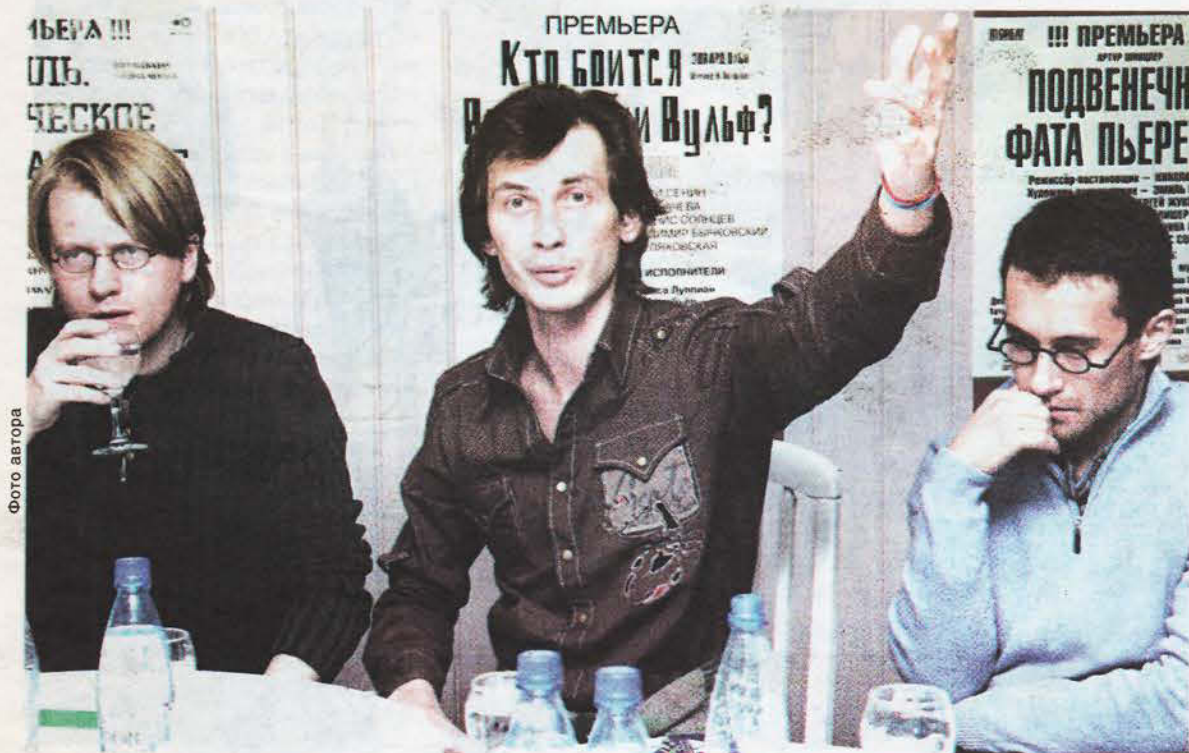
В наше время главное в театре, как и везде, — громко «выстрелить», создать Событие.