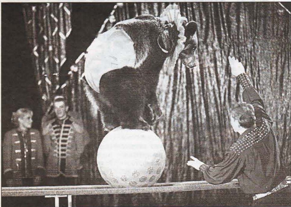
Режиссер-инспектор манежа следит и за оборудованием, и за состоянием артистов.

В канун 130-летия Цирка на Фонтанке инспектор манежа устроил нашему корреспонденту экскурсию по старинному зданию