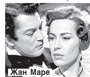
Жан Маре и Лиа Аманда в фильме «Граф Монте-Кристо».

55 (1955) — на экраны Франции вышел фильм «Граф Монте-Кристо» с Жаном Маре.