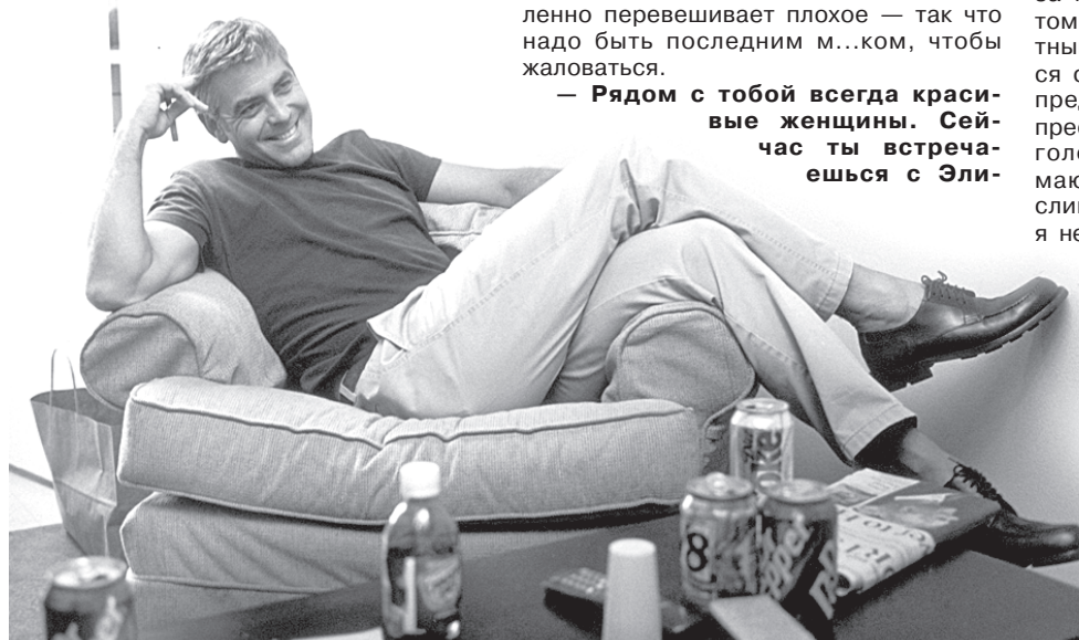
Джорджа Клуни можно увидеть в фильме «Мне бы в небо».

— Ты права, с годами все меняется. Чем старше становишься, тем активней участвуешь в жизни. Тем больше уверен в своей карьере и можешь сосредоточиться на чем-то другом. А у меня еще прекрасные друзья — мы дружим уже двадцать лет, и чем дальше, тем нам комфортней вместе. Это очень большая часть моей жизни.