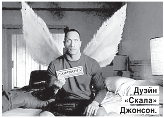
Дуэйн «Скала» Джонсон.

Фантастическая комедия. Дерек Томпсон — жестокий и грубый хоккеист, получивший прозвище Зубная Фея. Но настоящие феи не очень жалуют его и в качестве наказания отправляют хоккеиста поработать недельку-другую согласно прозвищу: находить детские зубы под подушкой и давать за них деньги.