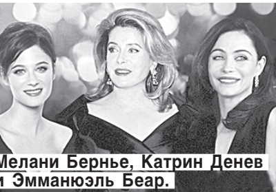
Мелани Бернье, Катрин Денев и Эмманюэль Беар.