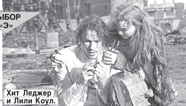
Хит Леджер и Лили Коул.