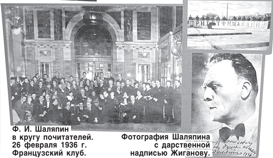
Ф. И. Шаляпин в кругу почитателей. 26 февраля 1936 г. Французский клуб.