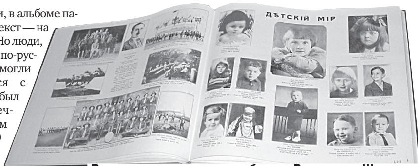
Репринтное издание альбома «Русские в Шанхае».