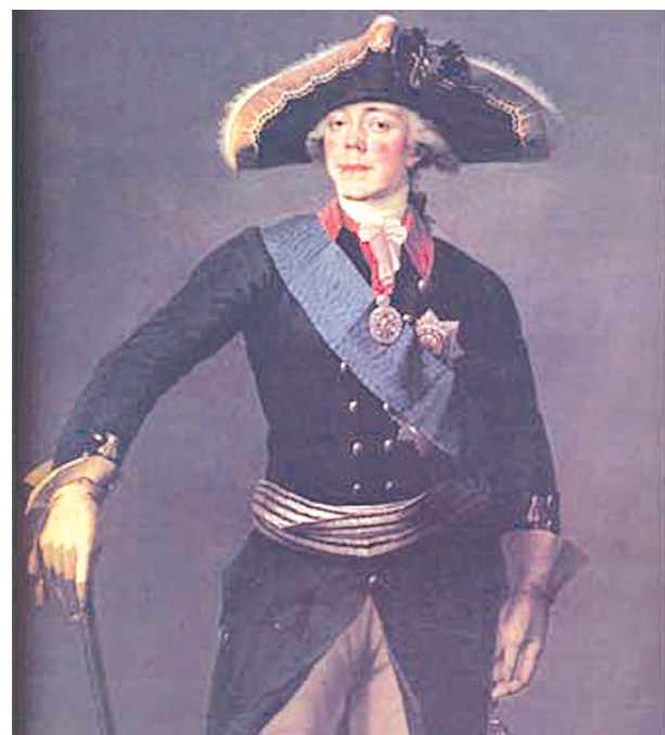
Степан Щукин. Портрет Павла I. 1796 — 1797.

Для победителей конкурса будет устроена экскурсия, во время которой они смогут побывать во всех дворцах Русского музея, причем в тех уголках, куда не так часто допускается публика. Будем рады получить ваши ответы по адресу: arsenevaz@mail.ru .