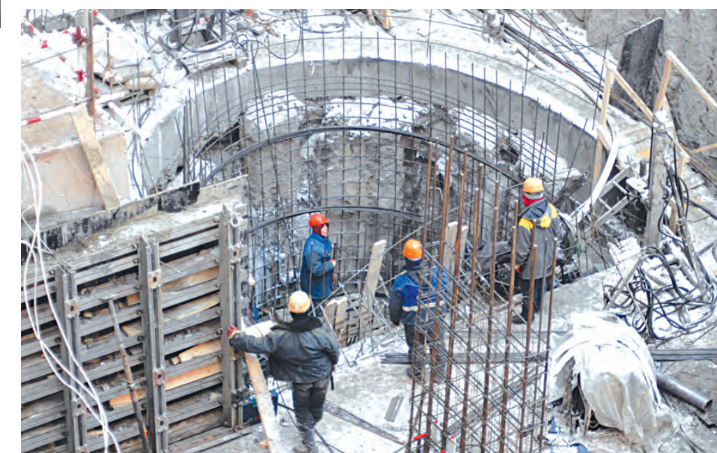
Одна из главных задач сейчас — прокладка инженерных сетей.

Почти все перекрытия в здании были усилены. Опасаясь, что проводимые работы могут спровоцировать подвижку старых тре-