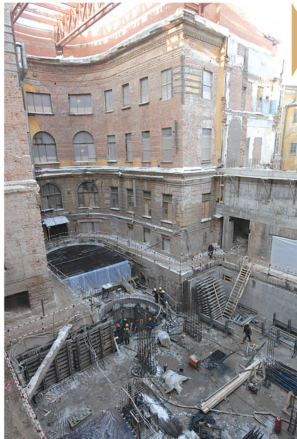
Именно отсюда по церемониальной лестнице публика будет заходить в музей.

— Обратите внимание: здесь сочетаются исторические фонари, сделанные еще при Росси, и новые. Картины должны видеть небо! Но поскольку климат в Петербурге особенный, полгода светло, а полгода темно, то мы делаем