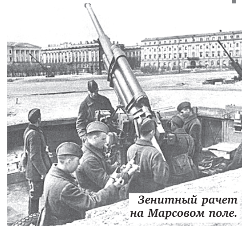
Зенитный рачет на Марсовом поле.

Одно из них, написанное в 14 лет, в День Победы, на развалинах своей квартиры, мы публикуем.