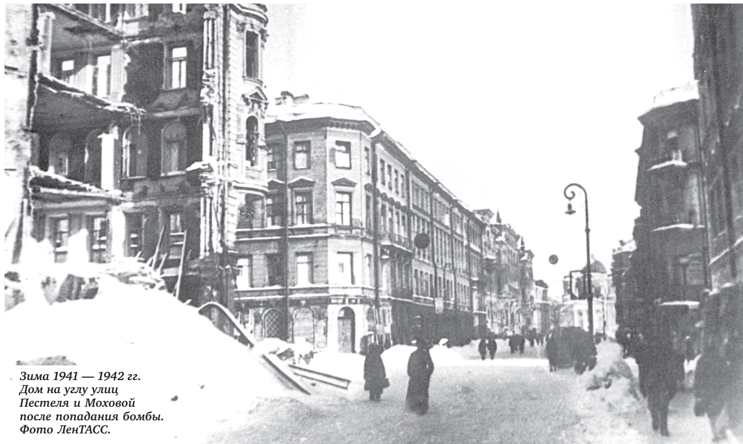
Зима 1941 — 1942 гг. Дом на углу улиц Пестеля и Моховой после попадания бомбы.