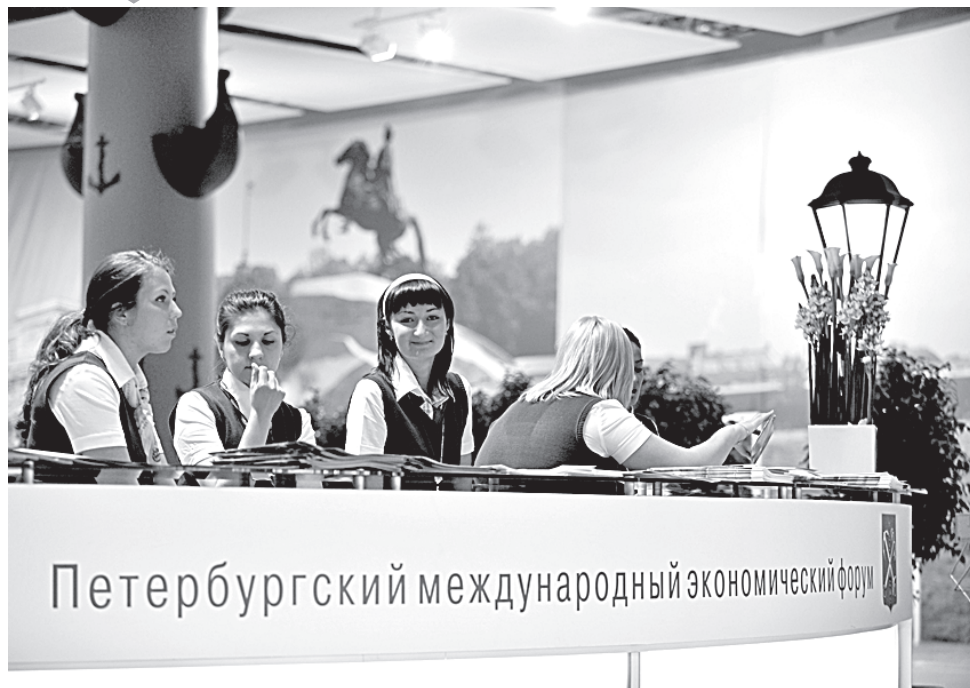
Задачи Петербургского форума коренным образом отличаются от задач Давосского.