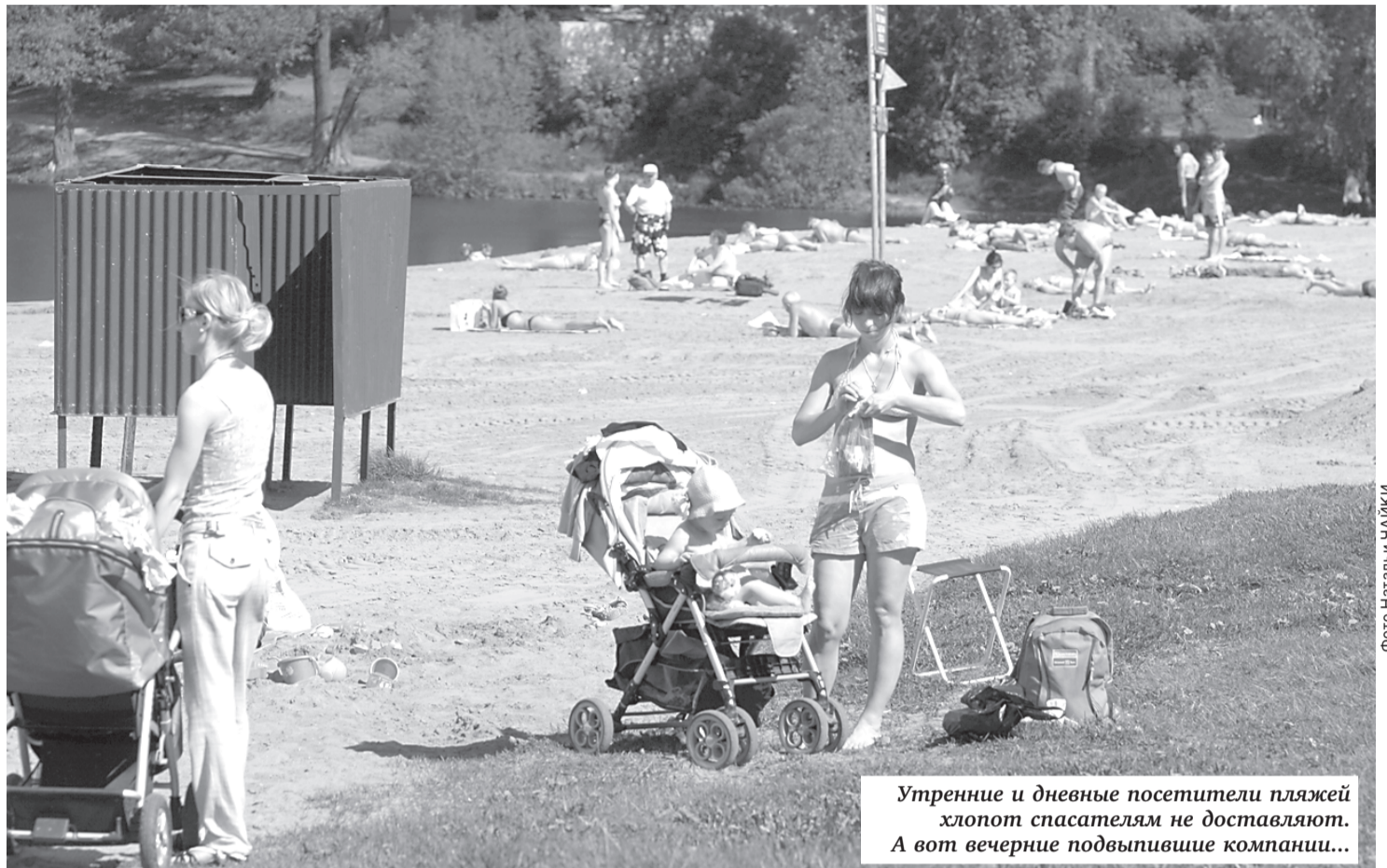
Утренние и дневные посетители пляжей хлопот спасателям не доставляют. А вот вечерние подвыпившие компании...