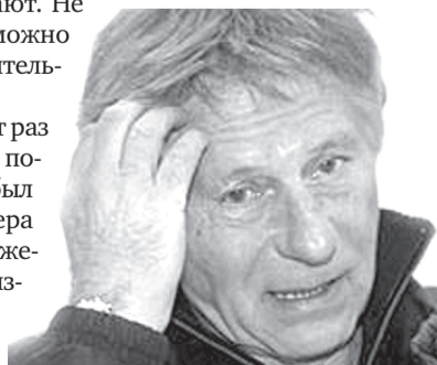
— Да не упомяну я вас всех!..

В мае 2010 года британская актриса Шарлотт Льюис обвинила Поланского — заявила, что Поланский надругался над ней «самым ужасным