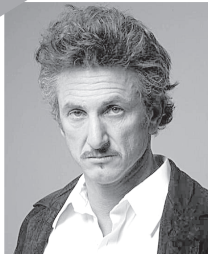
— Так вам сыграть или отредактировать?

Участие Шона Пенна, к сожалению, окончательно не утверждено — актер сейчас приступает к съемкам в триллере о стареющем рок-музыканте, который ищет нациста, казнившего его отца.