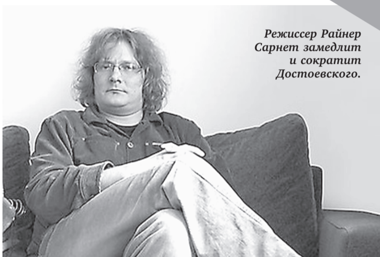
Режиссер Райнер Сарнет замедлит и сократит Достоевского.