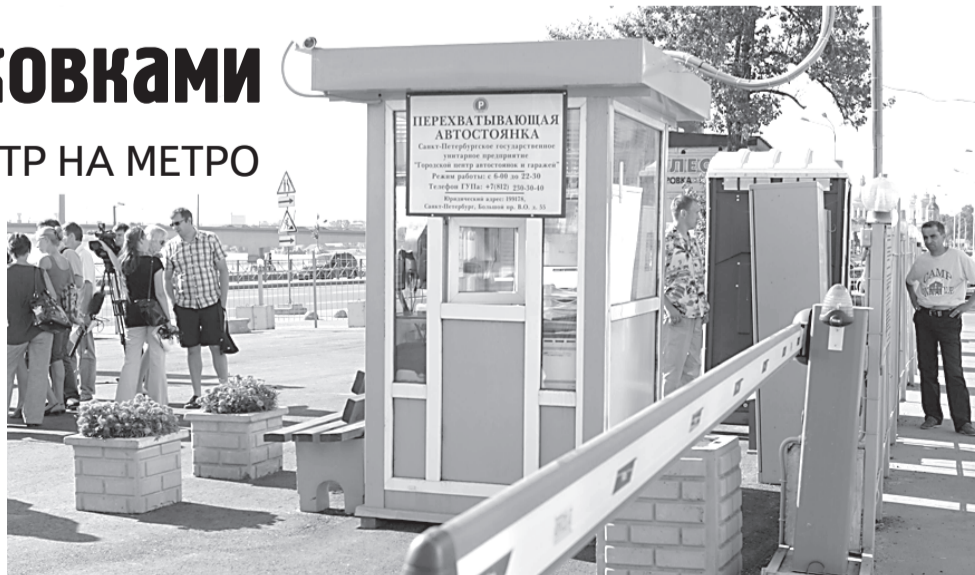
Развитие сети перехватывающих парковок позволит разгрузить транспортные магистрали города.