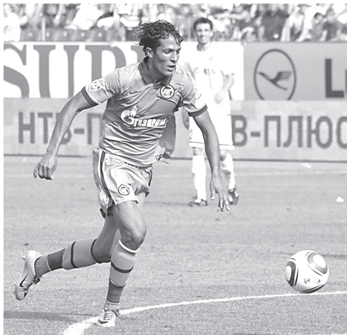
В «Осере» знают, что «Зенит» купил Бруну Алвеша.

Сегодня игроки «Зенита» примут у себя «Фабрику звезд» — именно так во Франции фанаты называют команду «Осер» (начало — в 20.30). В этом клубе подготовка доморощенных талантов поставлена на конвейер. Правда, звездами футбола воспитанники скромной бургундской «фабрики» становятся преимущественно на стороне.