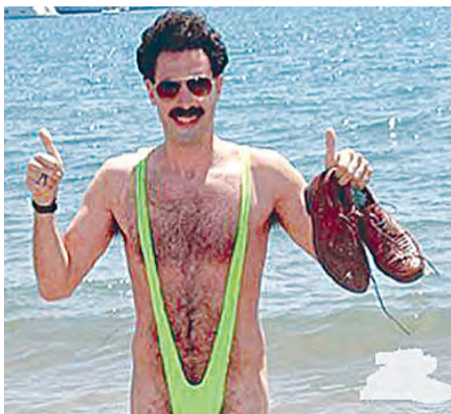
Из Саши Барона Коэна получился уж очень специфический представитель казахского народа. Неудивительно, что образ хотят подправить.

«Мы хотим проехаться на успехе «Бората». Воспользовавшись популярностью картины на Западе, покажем на этой волне зарубежному зрителю истинный, а не придуманный Сашей Бароном Коэном