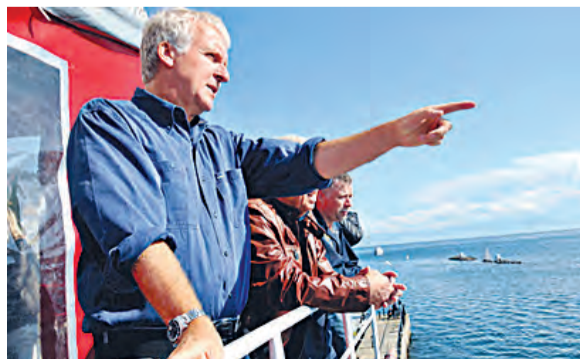
На дне Байкала Джеймс Кэмерон наверняка нашел такую же удивительную жизнь, как на планете Пандора.

РЕЖИССЕР кинофильмов «Аватар» и «Титаник» Джеймс Кэмерон погрузился на дно Байкала на глубоководном аппарате «Мир-1». Об этом сообщает Интерфакс.