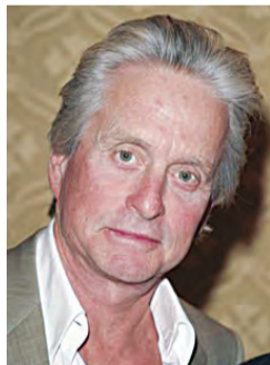
Майкл Дуглас — человек сильный. Он постарается.

Хоть все эти события разворачивались в далеких 70-х (первый фильм «Звездные войны. Эпизод IV: Новая надежда» вышел в прокат в 1977 году), Слай решил рассказать об этом своим поклонникам только сейчас. «Думаю, все к лучшему. Я плохо смотрюсь в костюме из спандекса и с лазерной пушкой в руках», — сказал Сталлоне.