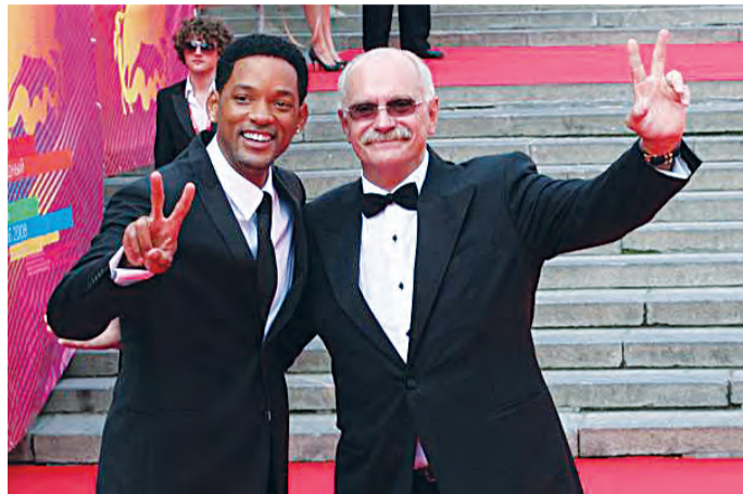
Никита Михалков уверен, что дорогих гостей вроде Уилла Смита надо принимать на виду у всей столицы.

На бездействие столичных властей в вопросе строительства Дворца кинофестивалей Михалков пожаловался в июле на встрече с премьер-министром Владимиром Путиным. Как заявил режиссер, московская власть обещала начать строить Дворец Московского кинофестиваля, но этого так и не произошло.