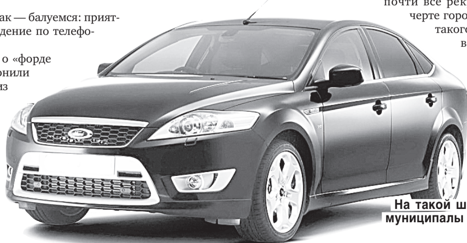
На такой шикарной иномарке муниципалы будут разъезжать по свалкам?