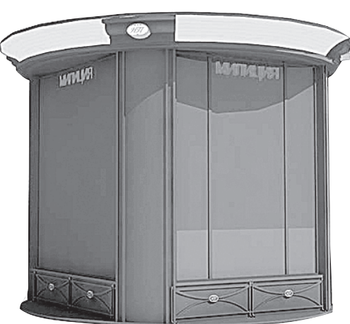
Для стражей порядка предусмотрены комфортабельные будки.