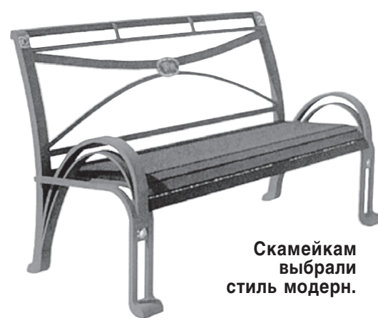
Скамейкам выбрали стиль модерн.