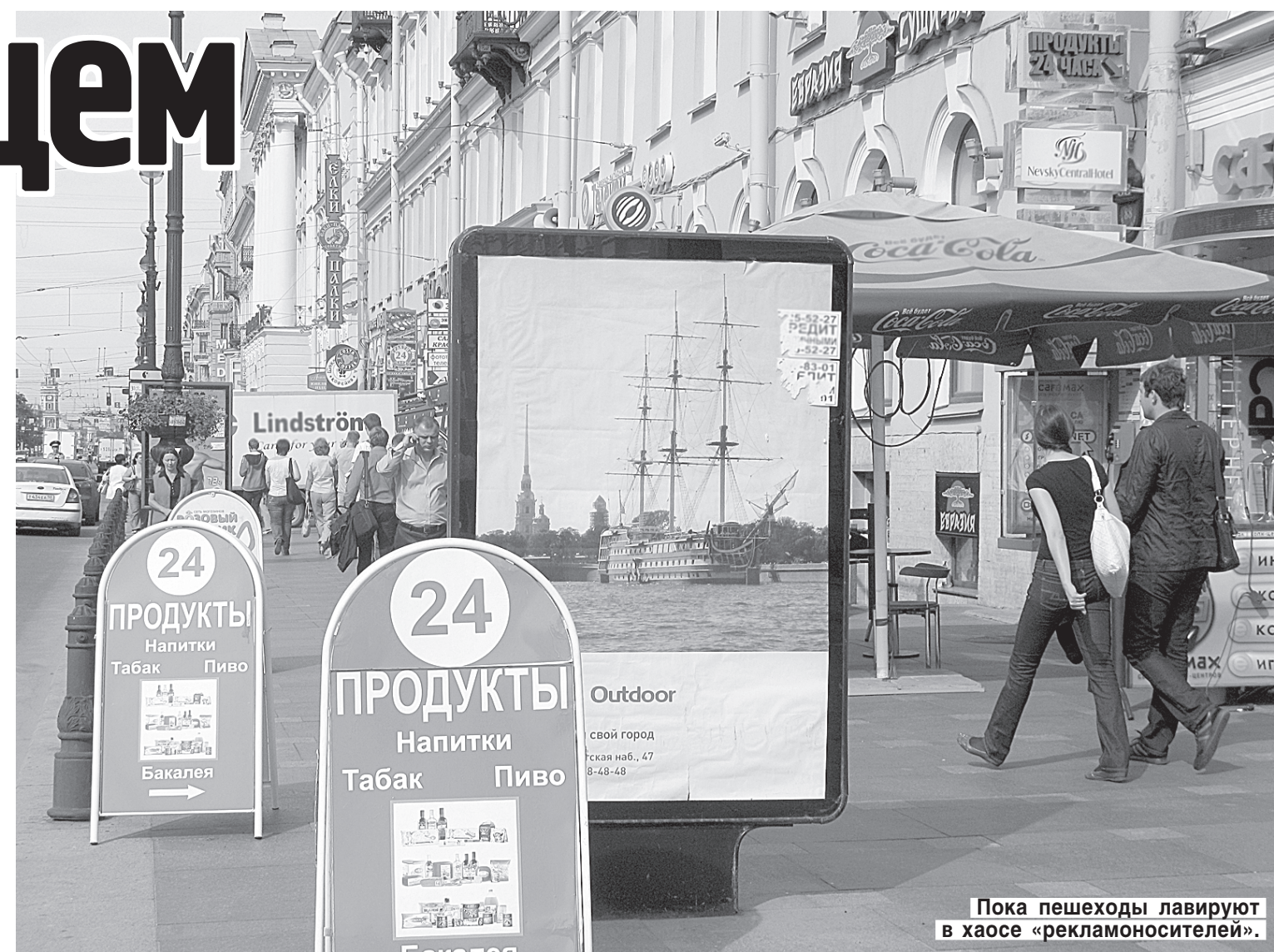
Пока пешеходы лавируют в хаосе «рекламоносителей».