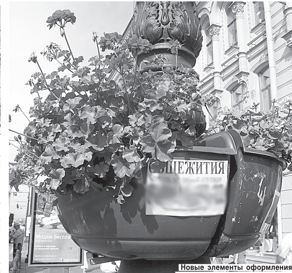
Новые элементы оформления уже страдают от вандализма.

голос. — Хотя непонятно, почему требуют именно этот, темно-бордовый цвет. Разве плох изумрудный или благородный синий, который вполне к лицу морскому городу? Как-то странно это — диктовать такую монополию, приобретение ткани одного артикула.