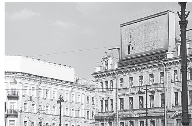
Площади Восстания также придется избавиться от рекламных щитов на крышах.