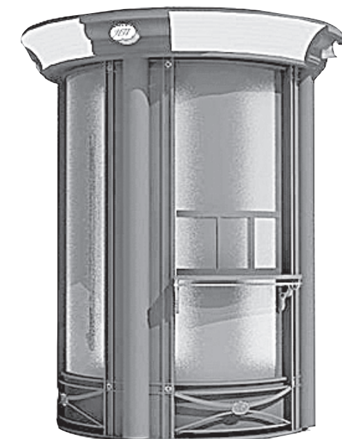
Наконец возродятся газетные киоски.