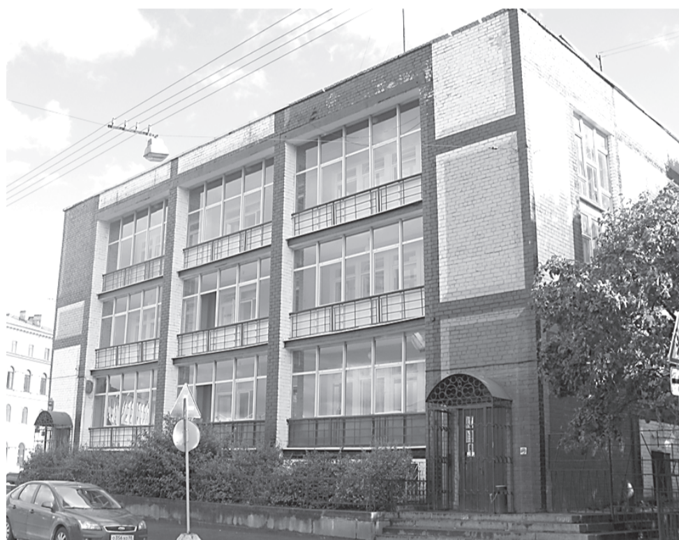
Участок с типовым детсадом был приобретен как пятно для застройки.

НАПРОТИВ ОСТРОВА-ПАМЯТНИКА ВЫРАСТЕТ ШЕСТИЭТАЖКА С НАКРЕНЯЮЩИМИСЯ УГЛАМИ — КГИОП И ГРАДОСТРОИТЕЛЬНЫЙ СОВЕТ НЕ ВОЗРАЖАЮТ