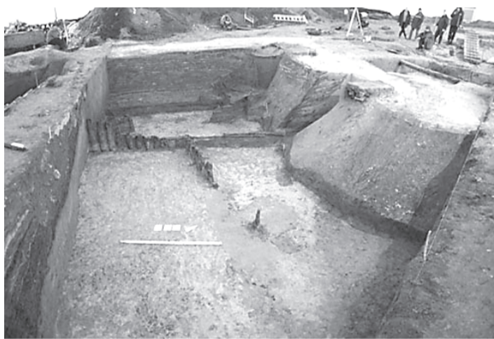
Этот исторический памятник накапливался тысячелетиями. Археологи называют его многослойным.

Итоги проделанной работы впечатляют. Коллекция камеральной лаборатории на