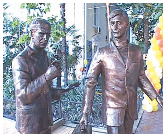
С любимыми героями теперь можно сфотографироваться.

Напомним, что совсем недавно, в мае, в городе Баку открылся памятник, увековечивший падение Семёна Семеновича на арбузной корке. Похоже, это эпидемия.