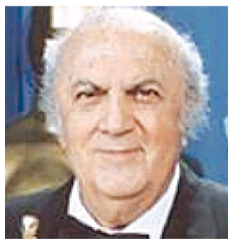
Во Львове все еще ждут Феллини.

ФЕДЕРИКО ФЕЛЛИНИ, умерший 17 лет назад, посетит львовский кинофестиваль «КиноЛев». С таким заявлением выступили чиновники, отвечающие за подготовку мероприятия.