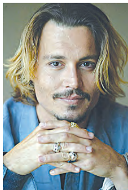
...и Джонни Депп: в глазах такая же загадка.

«Изначально я планировал, что По сыграет актер вроде Роберта Дауни. Собственно, я писал сценарий, имея в виду именно его. Теперь мне предстоит внести изменения. Возможно, для Джонни Деппа. Как вы понимаете, эту роль должен играть особый актер», — сказал Сталлоне.