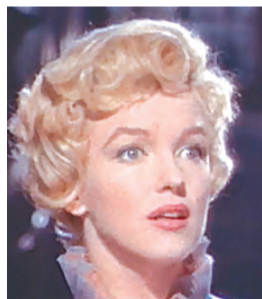
Джолли больше, чем Йоханссон, похожа на Мэрилин Монро, хоть и не блондинка?

Самая знаменитая блондинка сейчас вообще пользуется кинопопулярностью: помимо упомянутого фильма готовятся еще две кинобиографии Монро. В картине «Блондинка» легенду Голливуда изобразит Наоми Уоттс, а в байопике «Моя неделя с Мэрилин» Монро сыграет Мишель Уильямс.