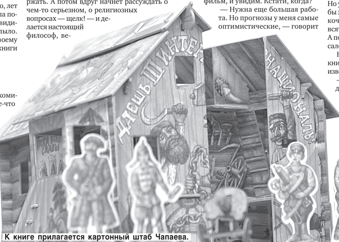
К книге прилагается картонный штаб Чапаева.