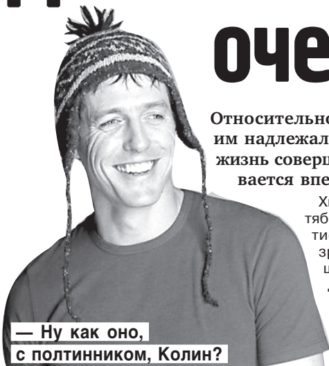
— Ну как оно, с полтинником, Колин?

Хью Грант и Колин Ферт, которые родились 9 и 10 сентября соответственно (оба в 1960-м), отмечают 50-летие. Отрицая соперничество, в котором их подозревали критики, они всегда излучали добродушие, признавали актерские достижения друг друга, верой и правдой служили британскому кинематографу и добросовестно исполняли роли настоящих англичан при фабрике грез. Приснопамятные же две драки за прелести Бриджит Джонс стали для зрителей и критиков символом того, что соперничество все же существует, и британские таблоиды пару раз публиковали робкие догадки о том, что заслуженные артисты Соединенного Королевства якобы вломили друг другу по-настоящему.