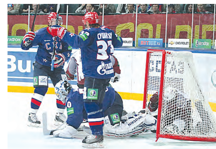
В двух стартовых играх из трех команда потерпела поражение.