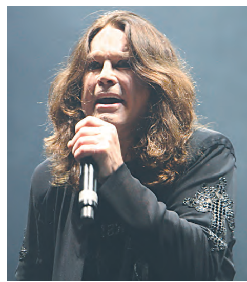
Для Оззи Осборна Петербург — прежде всего город Распутина.