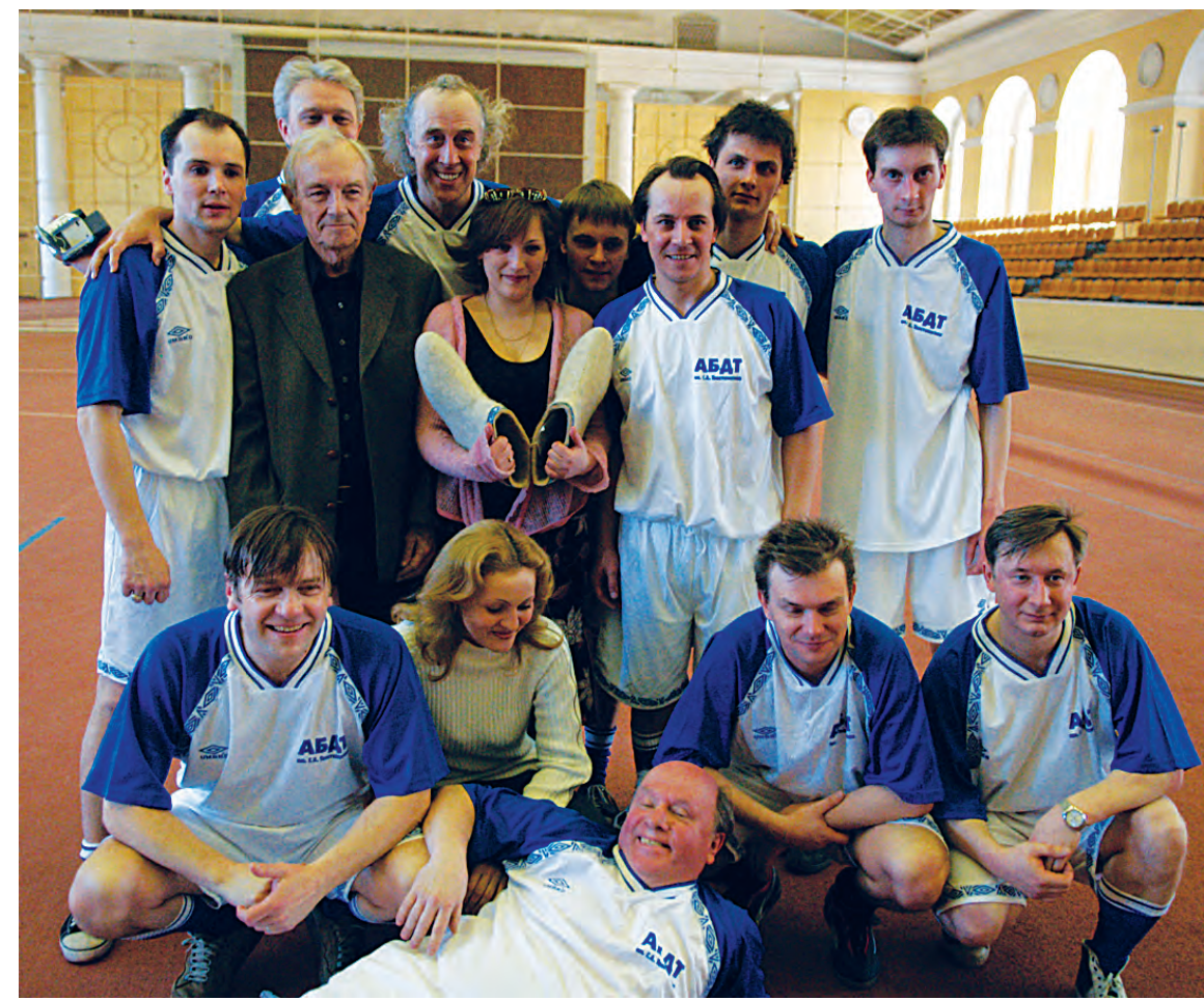
Команда БДТ образца 2005 года.