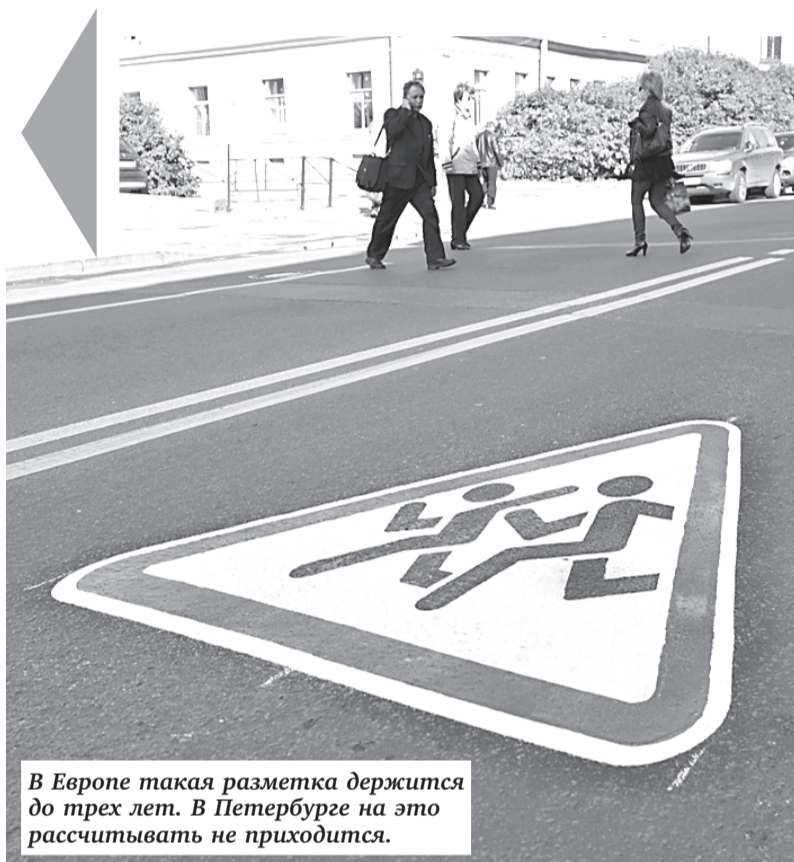
В Европе такая разметка держится до трех лет. В Петербурге на это рассчитывать не приходится.