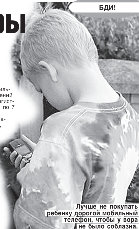
Лучше не покупать ребенку дорогой мобильный телефон, чтобы у вора не было соблазна.