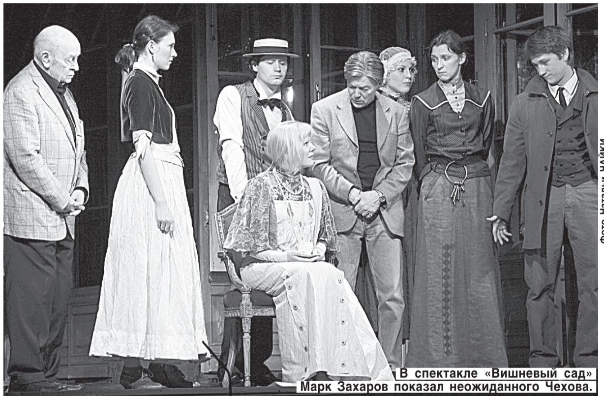
В спектакле «Вишневый сад» Марк Захаров показал неожиданного Чехова.

— Я думаю, что ничего в этом особенно нет. Вот этим летом я был с семьей в Германии, отдыхал и лечился. Очень красивое место, насыщенное, чистый воздух, очень там хорошо, иногда накрапывал дождик... И я смотрел каждый день эти страшные новостные программы про Москву, про Россию — жара, пожары... Я не думал, что могу так сопереживать! На физическом уровне — повышалось давление, усиливалось сердцебие-