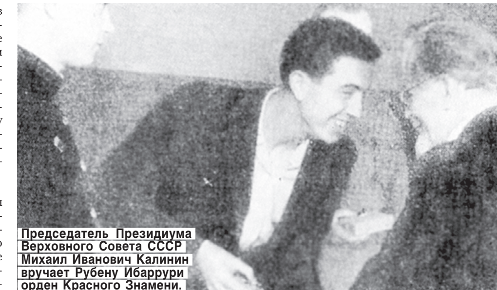
Председатель Президиума Верховного Совета СССР Михаил Иванович Калинин вручает Рубену Ибаррури орден Красного Знамени.

Открываю книгу «Единственный путь» с дарственной надписью автора моему отцу — «Вирхилио Льяносу с чувством сердечной дружбы и товарищества от Долорес Ибаррури» и читаю: «...трудно оценить горе, вмещающее материнским сердцем; но велика и способность этого сердца сопротивляться боли».