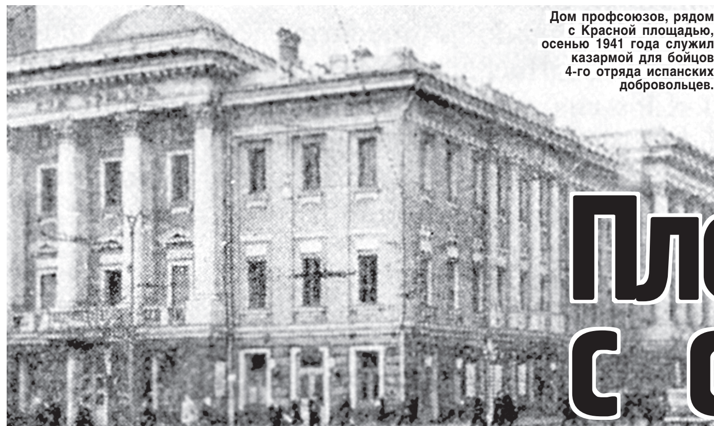
Дом профсоюзов, рядом с Красной площадью, осенью 1941 года служил казармой для бойцов 4-го отряда испанских добровольцев.