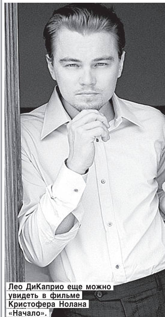
Леонардо ДиКаприо еще можно увидеть в фильме «Начало».

Еще недавно девушки развешивали на стенах его фотографии и рвали на себе волосы, когда он появлялся на экране. Он был юн, он был знаменит, и все шло к тому, чтобы в Голливуде появилась еще одна звезда. Но сейчас Леонардо ДиКаприо уже почти 36 (исполнится 11 ноября), и он превратился не в звезду, а в знаменитого и очень хорошего серьезного актера.