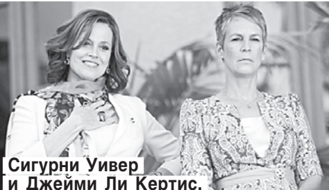
Сигурни Уивер и Джейми Ли Кертис.

КОМЕДИЯ. Марни узнает, что ее брат собирается жениться на ее бывшей однокласснице, превратившей школьные годы Марни в ад.