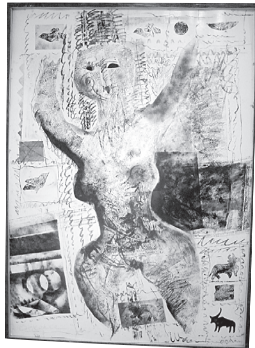
Неолитическая Венера. 2001.

Специально для выставки — учитывая специфику музея — Елена создала серию авторских игрушек, которая органично стала частью «Послания...». Какими игрушками и во что играли кроманьонские дети, мы, наверное, никогда уже не узнаем. Но, возможно, у них были куклы-солырки — не путать с топливом, это обереги, вместо лиц у них — круг и крест. И уж точно первобытные дети играли в охоту. Елена Щелчкова создает фигурки охотников и диких зверей из всего, что под руку попало: кусков фанеры, каких-то палочек, ключей от несуществующих дверей. «Сейчас очень моден так называемый ресайклинг — это направление придумали в Африке: из пред-