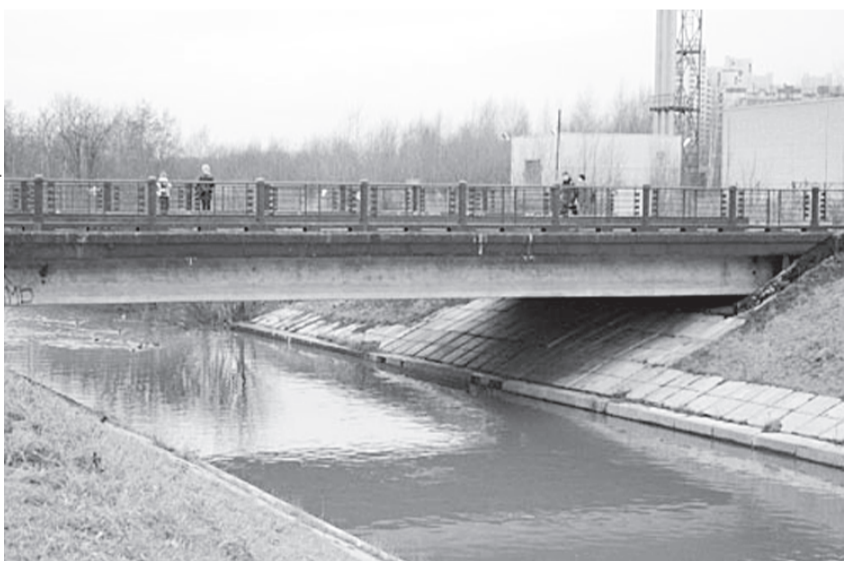
Деревня Клочки увековечена еще в одном топониме.

10 ФЕВРАЛЯ НЫНЕШНЕГО ГОДА ТАКОЕ НАЗВАНИЕ ПОЛУЧИЛ МОСТ ЧЕРЕЗ РЕКУ ОККЕРВИЛЬ. ЭТО ОБЪЯСНЯЕТСЯ ТЕМ, ЧТО ОН НАХОДИТСЯ В СТВОРЕ КЛОЧКОВА ПЕРЕУЛКА