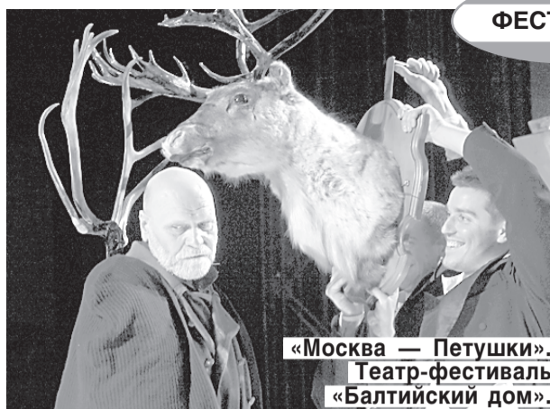
«Москва — Петушки». Театр-фестиваль «Балтийский дом».