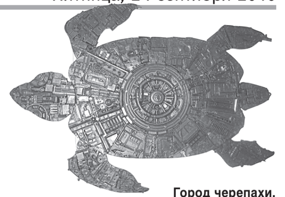
Город черепахи. 2010.