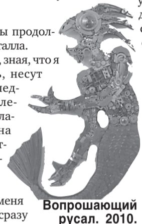
Вопрошающий русал. 2010.

Но мелкие работы продолжая делать из металла. Многие друзья, зная, что я этим занимаюсь, несут мне всякую вышедшую из употребления технику — благо устаревает она сейчас очень быстро. Иногда у кого-то в офисе компьютеры меняют, мониторы — и у меня они появляются сразу десятками. Бывает, вижу какую-нибудь деталь и сразу решаю — это будет решетка в замке, а это верхушка башни, но обычно я их просто складываю и они ждут своего часа.