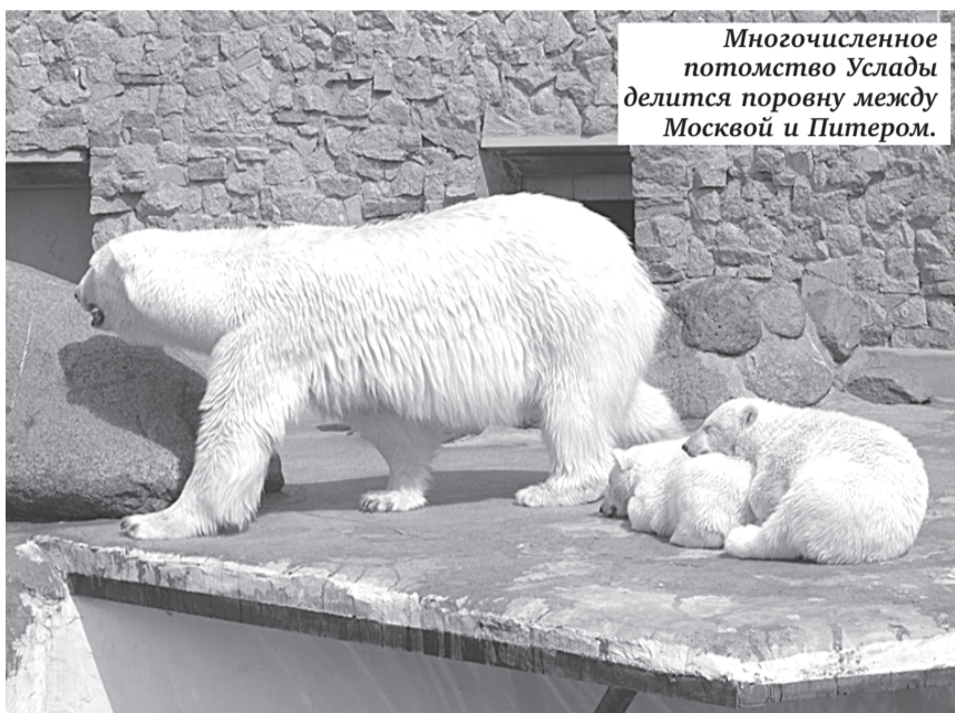
Многочисленное потомство Услады делится поровну между Москвой и Питером.