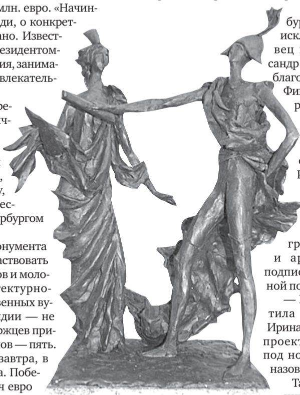
Один из проектов: Александр I протягивает деве Финляндии декларацию об автономии.