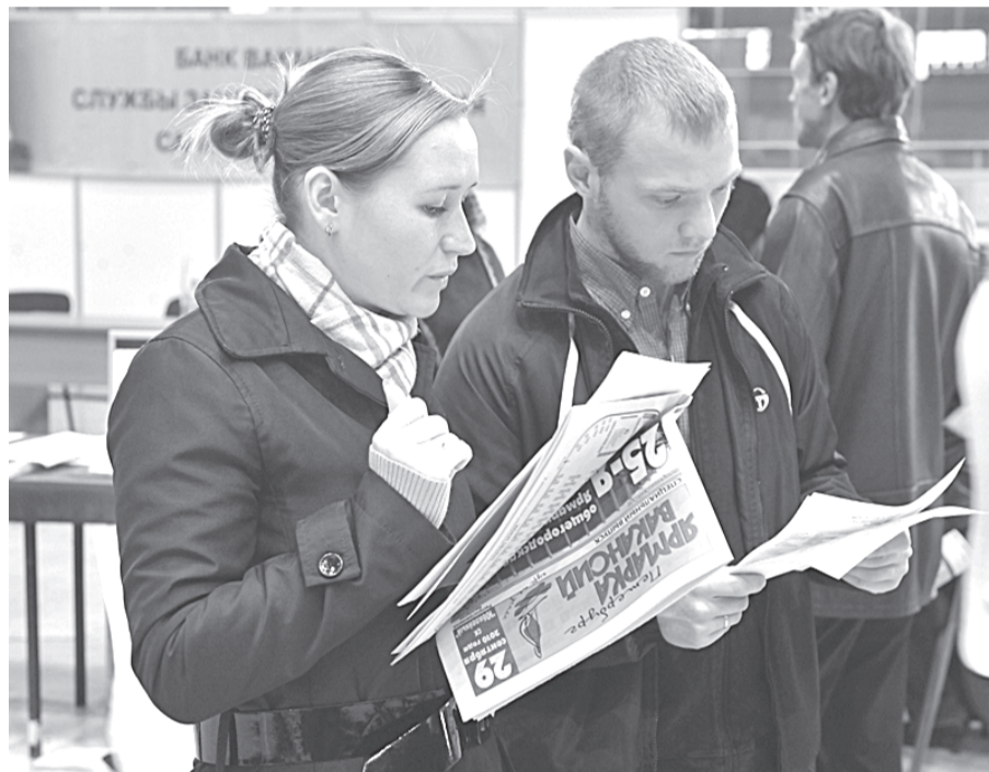
«Фишка» осенней общегородской ярмарки — возможность в один день охватить необъятное.

Предлагали на ярмарке в основном рабочие специальности. Для тех, кто хочет научиться, город предлагает 140 (!) про-