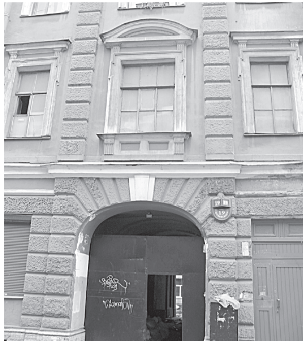
Этот фасад вскоре будет уничтожен.

— Какой орган государственной власти и какое должностное лицо правительства Санкт-Петербурга несет ответственность за решение о невозможности ликвидации аварийности исторического здания? — был задан вопрос Валентине Матвиенко.