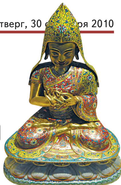
Изображение выдающегося деятеля тибетского буддизма Цонкапы. Китай. XIX век.