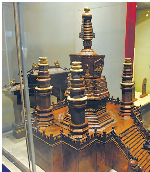
Модель ступы Хуансы в Пекине, выполненная из меди.