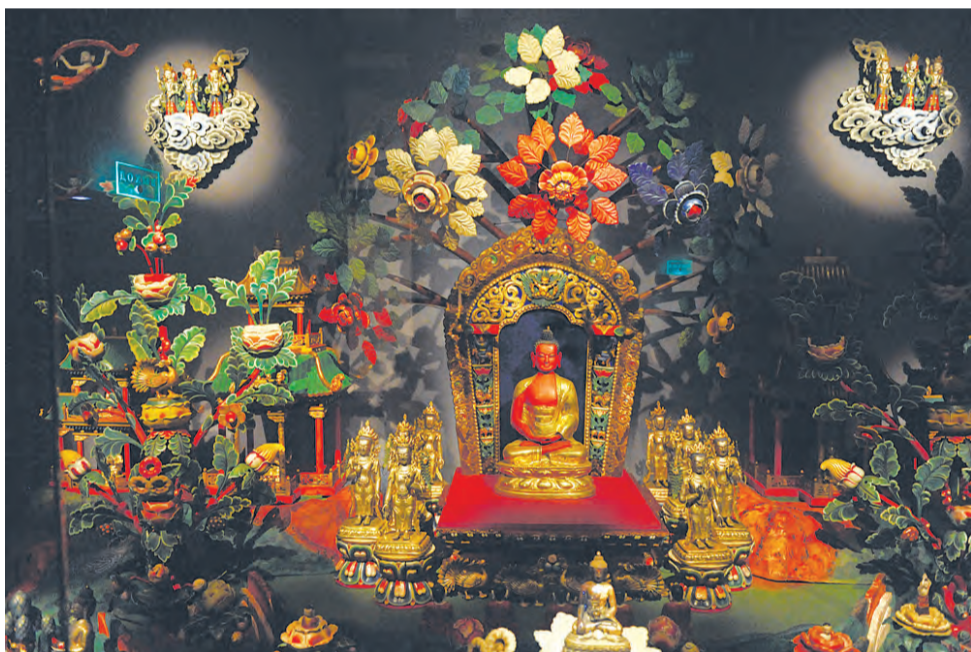
«Сукхавати — Чистая земля будды Амитабхи», или «Буддийский рай».