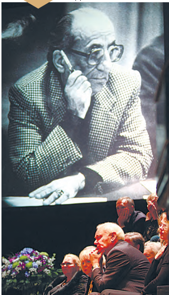
В этот вечер с гостями говорил сам юбиляр...