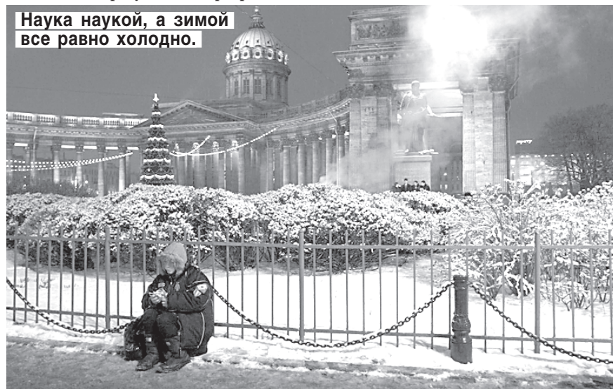
Наука наукой, а зимой все равно холодно.