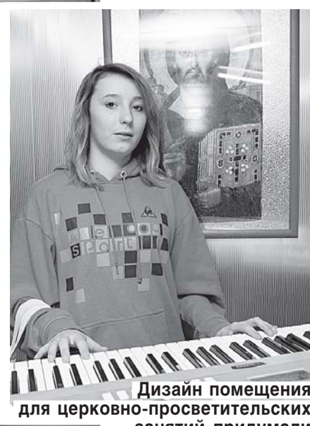
Дизайн помещения для церковно-просветительских занятий придумали сами подростки.