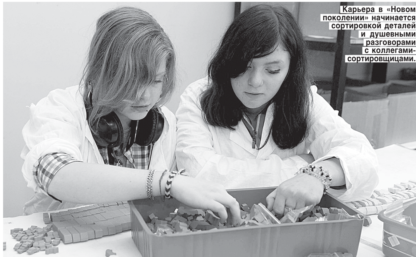
Карьера в «Новом поколении» начинается с сортировкой деталей и душевными разговорами с коллегами-сортировщицами.

От восьми подобных предприятий, находящихся в разных районах города и Ленобласти, «Новое поколение» на улице Доблести отличается возведенной прямо во дворике церковью. Сюда, в храм Святых Равноапостольных Константина и Елены, подростки приходят только по желанию. И приходят практически все.