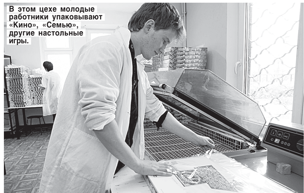
В этом цехе молодые работники упаковывают «Кино», «Семью», другие настольные игры.

У 90% детей, оказавшихся в «Новом поколении», очень серьезные проблемы дома, в семье. Вот оно, лишнее подтверждение тому, что институт семьи в России в плачевном состоянии. И как результат — дворовая одинокая, озлобленная молодежь.