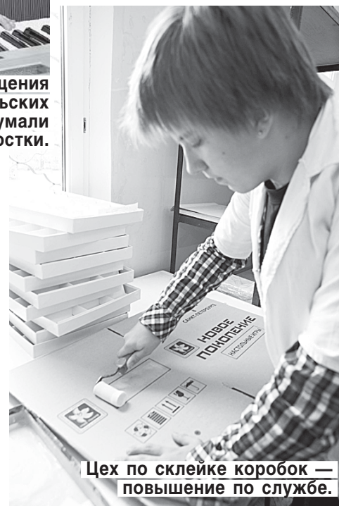
Цех по склейке коробок — повышение по службе.

Некоторых работников мастера будят лично, ведь здесь же, в «Новом поколении», расположена социальная гостиница для временного проживания. Она рассчитана только на мальчиков. Так заведено, а почему — никто не знает. Так или иначе, пользуются ею многие ребята. Всякое бывает: отчим-наркоман, мама на полгода отправлена в психбольницу, старший брат напивается и изнутри запирает входную дверь. А здесь можно переночевать (при условии: никаких гостей и алкоголя), посмотреть телевизор, и даже библиотека имеется. Среди книжек и братья Стругацкие, и даже Чехов, но, по словам местных смотрителей, здешние подростки читают разве что пару глав фантастики с яркими обложками и «Встречу тиранов» Кира Булычева.