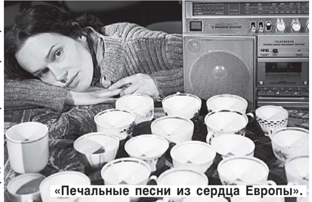
«Печальные песни из сердца Европы».