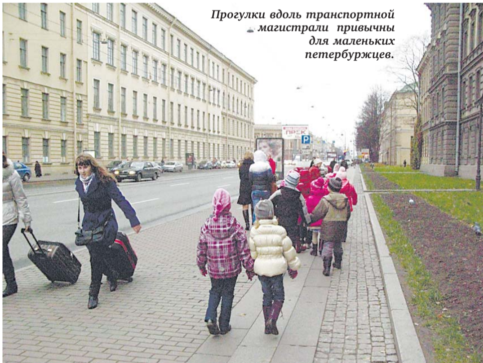
Прогулки вдоль транспортной магистрали привычны для маленьких петербуржцев.