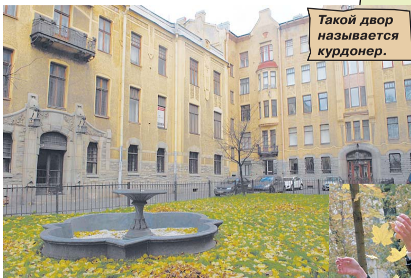
Такой двор называется курдонер.