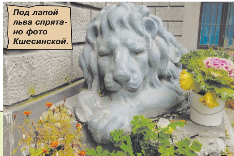
Под лапой льва спрятано фото Кшесинской.