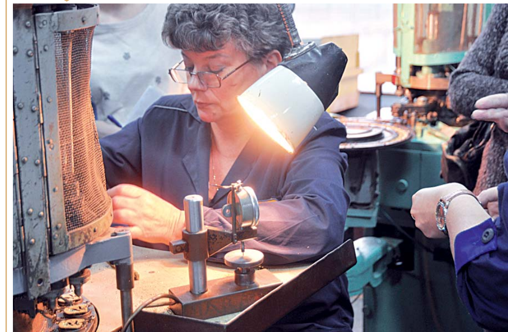
Завод сумел не растерять профессионалов, а теперь обучает мастерству молодых.