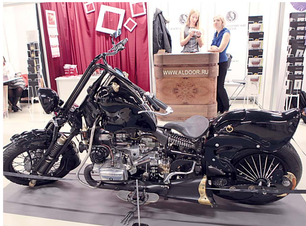
«Кованый мотоцикл»: Викторианская эпоха во плоти.

На этом месте с Асей мне приходится попрощаться, ибо ее уносит поток оперативных дел члена жюри, а я, слетев на четыре этажа вниз, оказываюсь в микромире стимпанка. Что это? Это