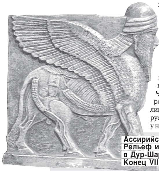
Ассирийский крылатый бык. Рельеф из дворца Саргона II в Дур-Шаррукине. Конец VIII века до н. э.