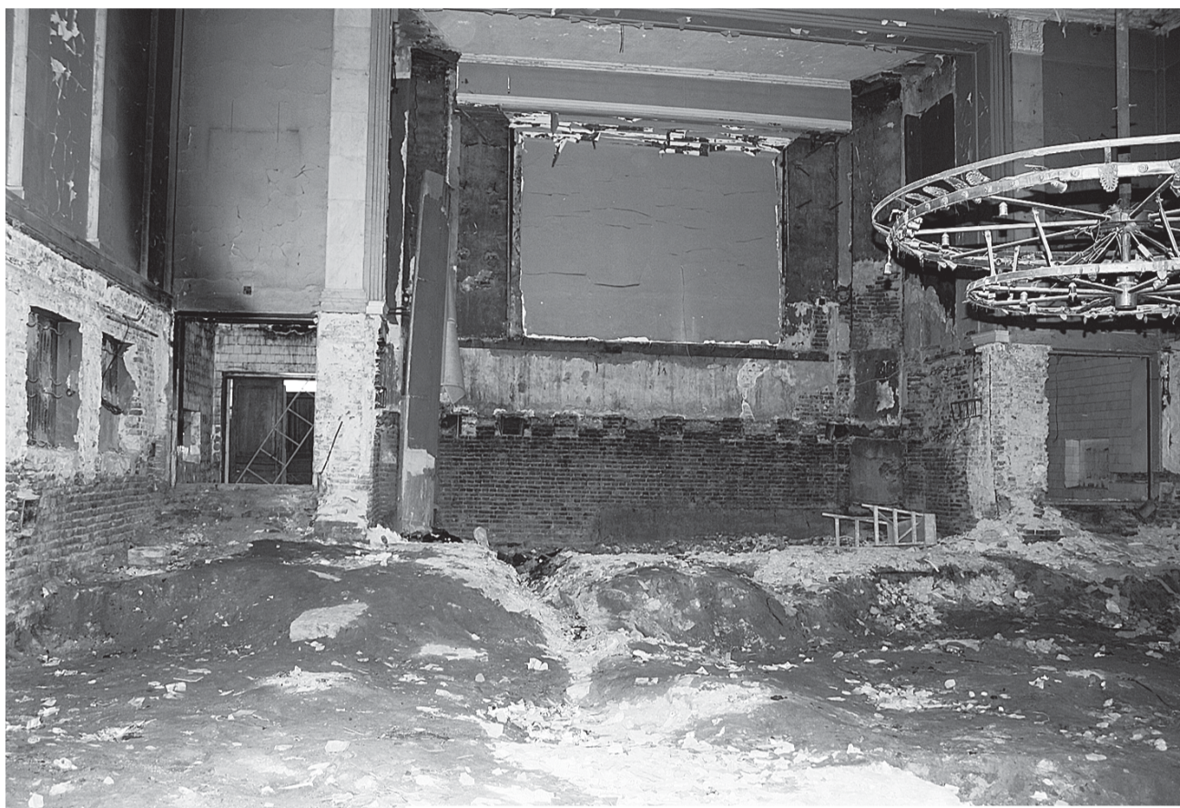
Кинотеатр «Москва» на Старо-Петергофском проспекте пребывает в запустении с 2004 года.