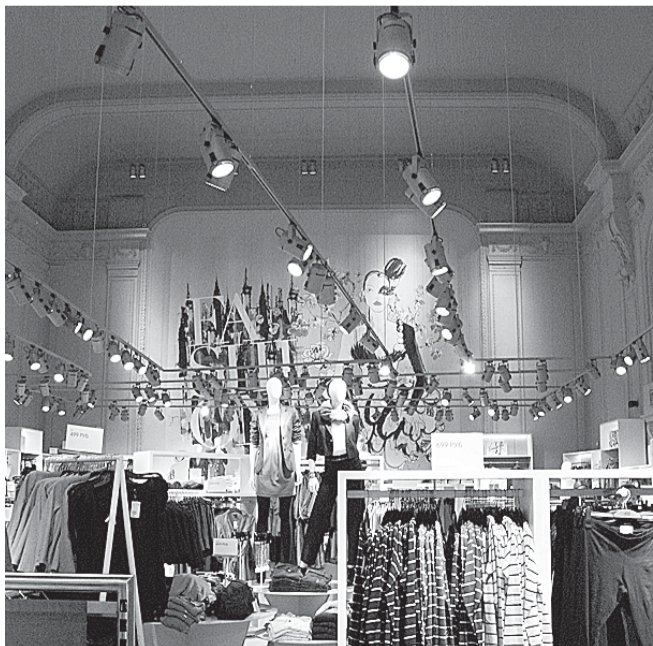
Изысканный зрительный зал «Паризианы» на Невском превращен в магазин готовой одежды массового производства.

Итог наших обещаний читателям: в «Паризиане» ни боулинга, ни кинематографа, ни ресторана — там заурядное торговое место в интерьере, который мог бы послужить и кинотеатру, и театру, и выставочному залу. Очаг культуры городом утерян.