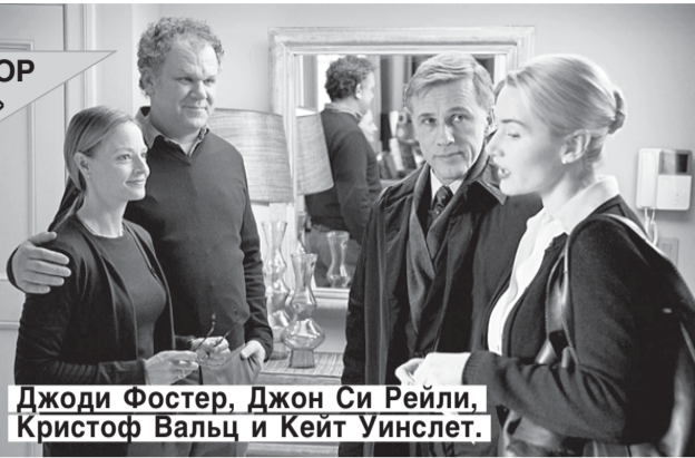
Жюди Фостер, Джон Си Рейли, Кристоф Вальц и Кейт Уинслет.