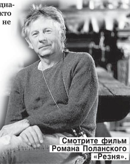
Смотрите фильм Романа Поланского «Резня».

— Это была маленькая, будто средневековая, деревушка. Есть, кроме каши, было нечего. В семье, которая меня приютила, было трое детей. Мать была очень доброй, очень религиозной. Она меня любила. Меня могли схватить в любой момент. Слава богу, внешность у меня была вполне польская, так что мне было легко прятаться.