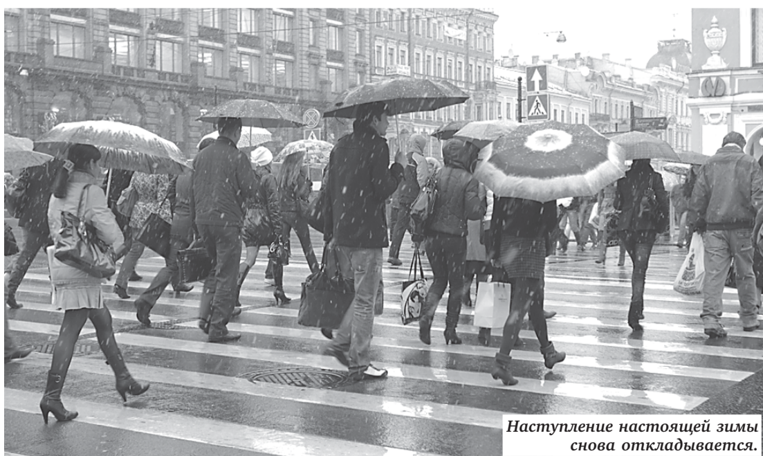
Наступление настоящей зимы снова откладывается.

Температура воздуха по-прежнему отстает от среднеклиматической нормы, и всю неделю ее показатели будут меняться от 0 до плюс 3 градусов.